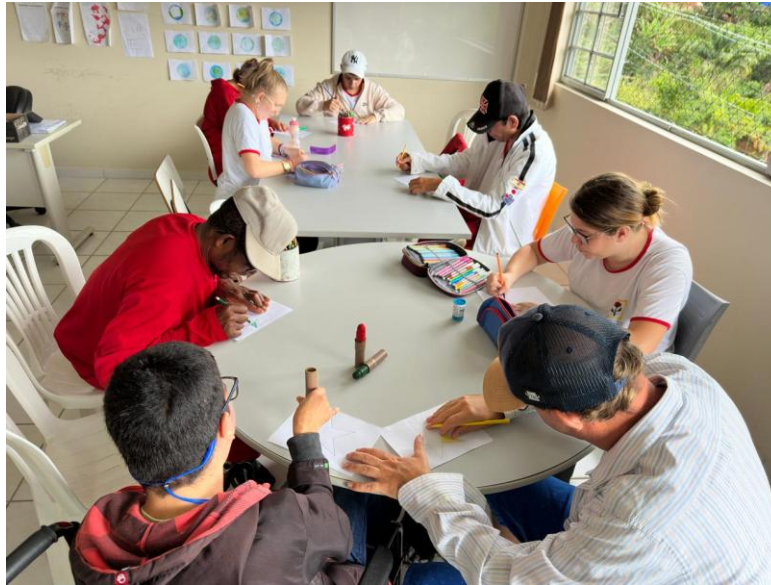
Figura 5 – Confeção dos desenhos da família (novembro)

ASSOCIAÇÃO PESTALOZZI DE SANTA TERESA CNPJ: 32.405.664.0001-27 CAEE "MANOEL VALENTIM" CERES "GLORINHA MONTEIRO" CEVI "IDÊ VACCARI GARAYP" Utilidade Pública Federal publicada no Diário Oficial da União em 28 de março de 2002 Utilidade Pública Estadual Lei nº7999 Lei de Utilidade Pública Municipal nº1.546/2004 Recredenciamento de Acordo com a Resolução CEE - ES nº 5.935/2021