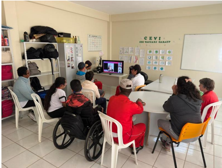
Figura 3 – Live do aniversário do MONPAD (outubro)

ASSOCIAÇÃO PESTALOZZI DE SANTA TERESA CNPJ: 32.405.664.0001-27 CAEE "MANOEL VALENTIM" CERES "GLORINHA MONTEIRO" CEVI "IDÊ VACCARI GARAYP" Utilidade Pública Federal publicada no Diário Oficial da União em 28 de março de 2002 Utilidade Pública Estadual Lei nº7999 Lei de Utilidade Pública Municipal nº1.546/2004 Recredenciamento de Acordo com a Resolução CEE - ES nº 5.935/2021