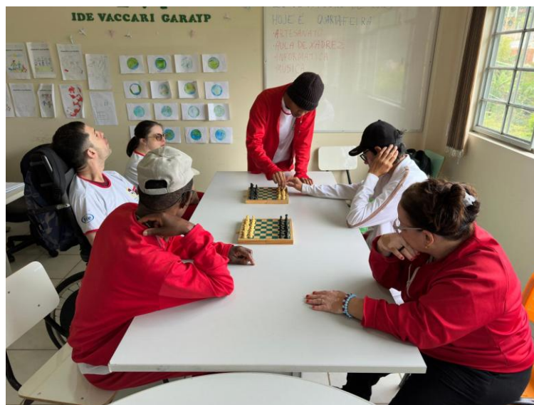
Figura 2 – Aulas de Xadrez (outubro)