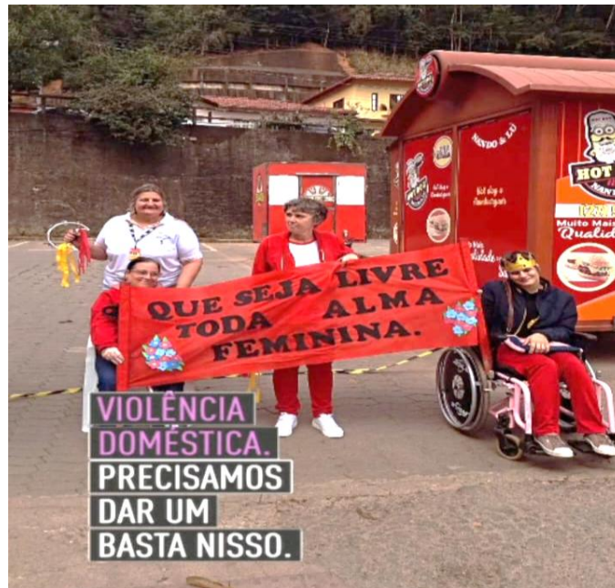
Atendimento a família com equipe

ASSOCIAÇÃO PESTALOZZI DE SANTA TERESA CNPJ: 32.405.664.0001-27 CAEE "MANOEL VALENTIM" CERES "GLORINHA MONTEIRO" CEVI "IDÊ VACCARI GARAYP" Utilidade Pública Federal publicada no Diário Oficial da União em 28 de março de 2002 Utilidade Pública Estadual Lei nº7999 Lei de Utilidade Pública Municipal nº1.546/2004 Recredenciamento de Acordo com a Resolução CEE - ES nº 5.935/2021