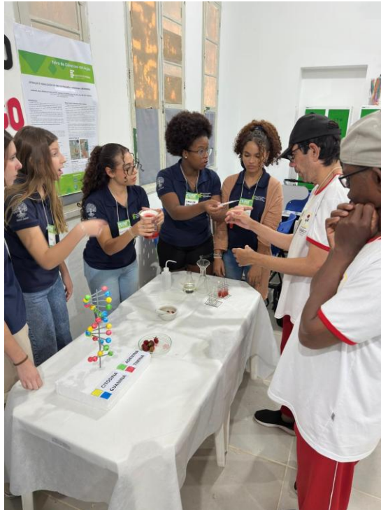
Figura 1 – Visita a feira de ciências do IFES (outubro)

ASSOCIAÇÃO PESTALOZZI DE SANTA TERESA CNPJ: 32.405.664.0001-27 CAEE "MANOEL VALENTIM" CERES "GLORINHA MONTEIRO" CEVI "IDÊ VACCARI GARAYP" Utilidade Pública Federal publicada no Diário Oficial da União em 28 de março de 2002 Utilidade Pública Estadual Lei nº7999 Lei de Utilidade Pública Municipal nº1.546/2004 Redeenciamento de Acordo com a Resolução CEE - ES nº 5.935/2021