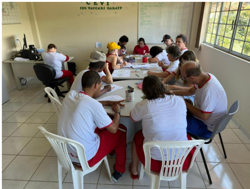
Figura 6 – Pintura sobre o Natal (dezembro)