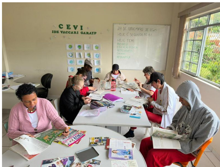
Figura 4 – Trabalho com recortes em revistas (novembro)