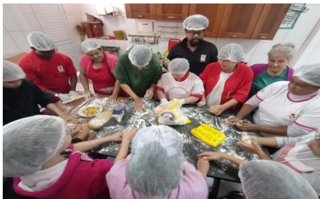
Oficina de Massas com CEVI e CAEE.

Com isso, vale ressaltar a importância do trabalho realizado na área de Terapia Ocupacional para prevenção, proteção e promoção de saúde dos alunos, usuários e comunidade atendidos por esta entidade no município de Santa Teresa – ES.