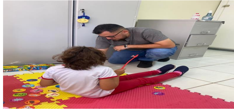
Atividade de Pareamento.