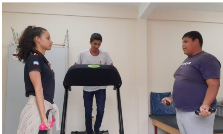
Exercícios de preparação para competição e fortalecimento.