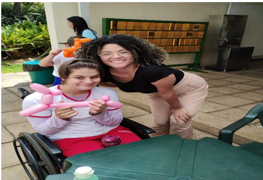
Acompanhamento em uma das atividades externas (museu de Santa Teresa)