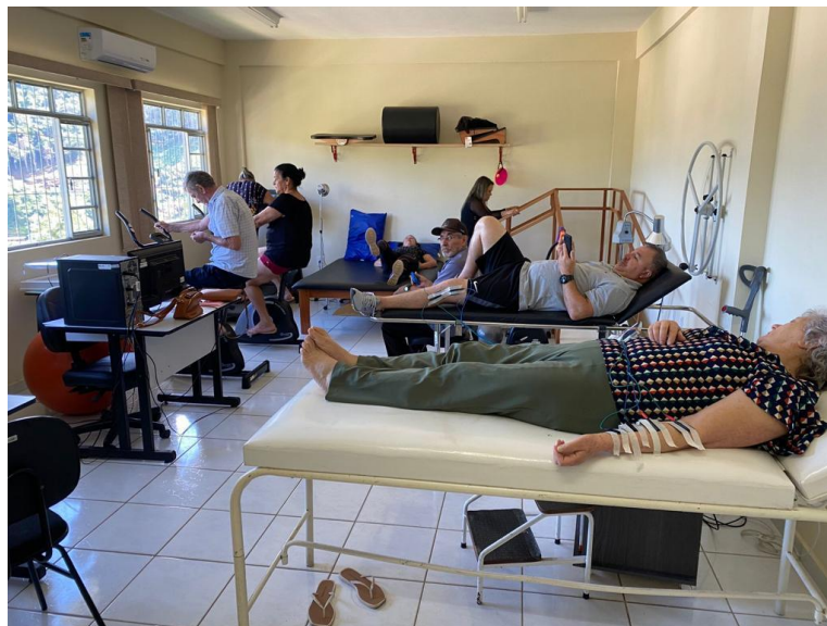
Atendimento Fisioterapêutico e Interação Social

Após análise do relatório exposto, vale ressaltar a importância do trabalho realizado na área de fisioterapia para prevenção, proteção e promoção de saúde por esta entidade no município de Santa Teresa – ES.