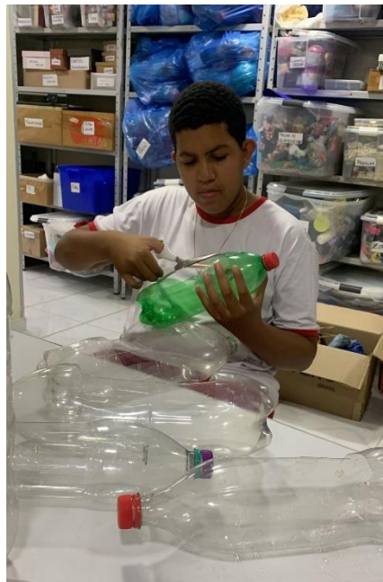
Jardineira para utilização no plantio de mudas.