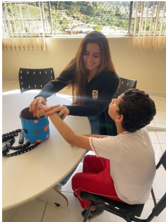
Estimulação sensorial com pistas cinestésicas.