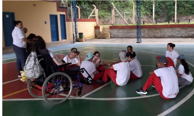
Atividades realizadas no Fazenda Clube.