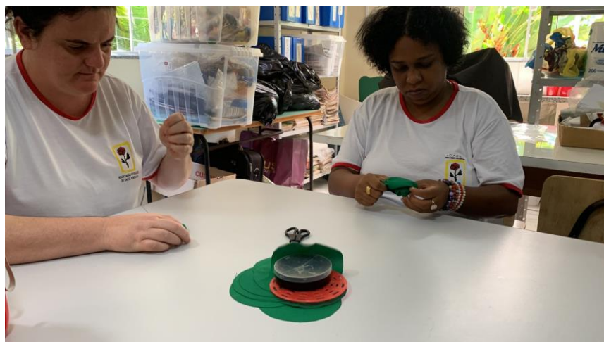
Confecção de fuxicos.