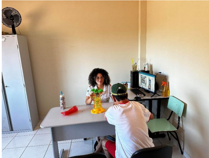
Atendimento individual em psicoterapia com alunos do centro de vivência

ASSOCIAÇÃO PESTALOZZI DE SANTA TERESA CNPJ: 32.405.664.0001-27 CAEE "MANOEL VALENTIM" CERES "GLORINHA MONTEIRO" CEVI "IDÊ VACCARI GARAYP" Utilidade Pública Federal publicada no Diário Oficial da União em 28 de março de 2002 Utilidade Pública Estadual Lei nº7999 Lei de Utilidade Pública Municipal nº1.546/2004 Recredenciamento de Acordo com a Resolução CEE - ES nº 5.935/2021