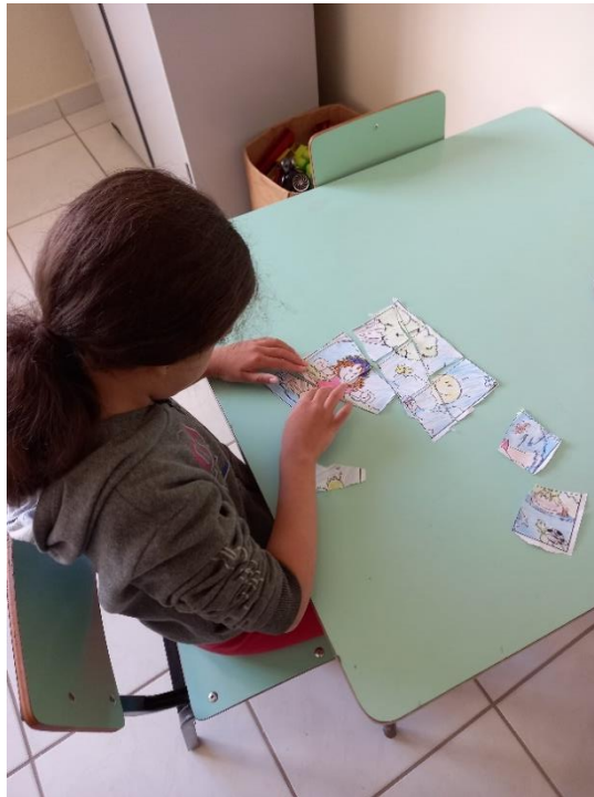
Atendimento individual em psicoterapia

ASSOCIAÇÃO PESTALOZZI DE SANTA TERESA CNPJ: 32.405.664.0001-27 CAEE "MANOEL VALENTIM" CERES "GLORINHA MONTEIRO" CEVI "IDÊ VACCARI GARAYP" Utilidade Pública Federal publicada no Diário Oficial da União em 28 de março de 2002 Utilidade Pública Estadual Lei nº7999 Lei de Utilidade Pública Municipal nº1.546/2004 Recredenciamento de Acordo com a Resolução CEE - ES nº 5.935/2021