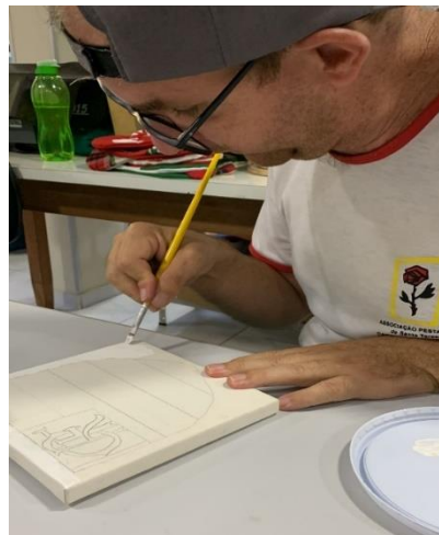
Pintura em tela.