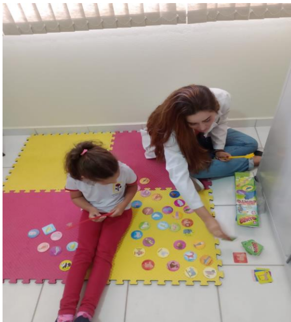
Acesso lexical e onomatopeias.

Após análise do relatório exposto, vale ressaltar a importância do trabalho realizado na área da fonoaudiologia abordando as especialidades mencionadas anteriormente, visando a promoção, prevenção, avaliação, diagnóstico, terapia e orientação dos usuários e das famílias assistidas pela Associação Pestalozzi de Santa Teresa.