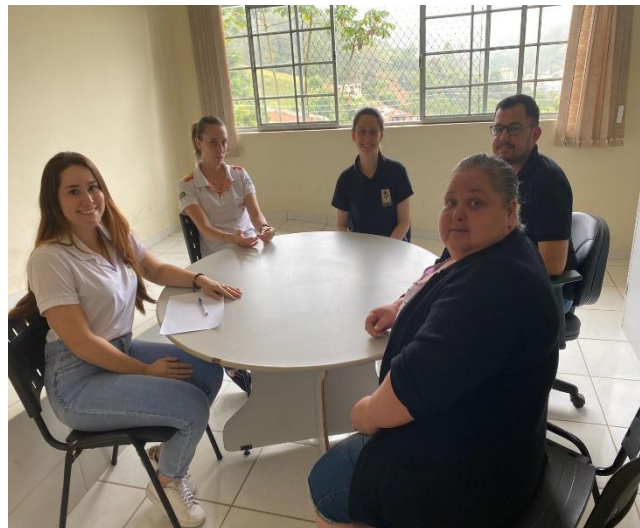
Devolutiva dos atendimentos da equipe clínica para os pais