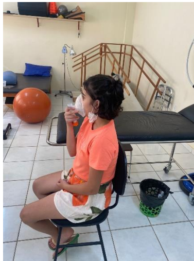
Fisioterapia Respiratória na Fibrose Cística