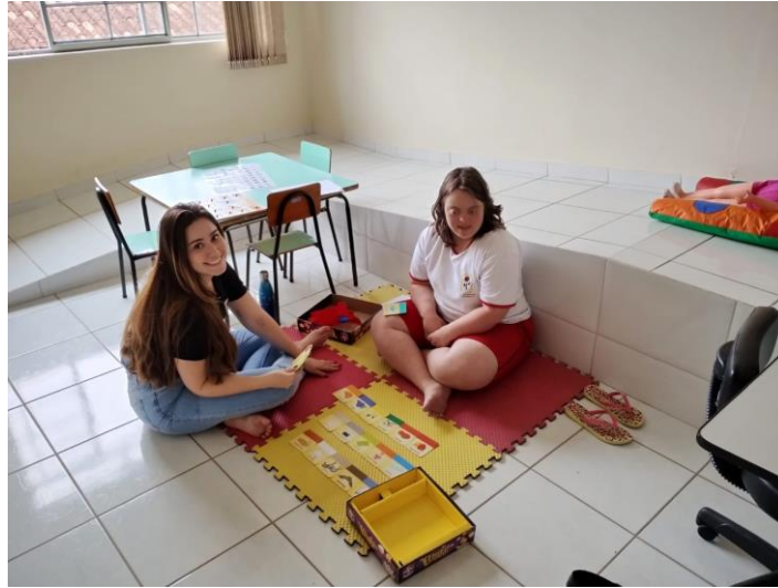
Categorização e semântica com auxílio de pistas visuais.

Recredenciamento de Acordo com a Resolução CEE - ES nº 5.935/2021