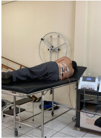
Atendimento Fisioterapêutico no Pós Operatório de Hérnia de Disco

ASSOCIAÇÃO PESTALOZZI DE SANTA TERESA CNPJ: 32.405.664.0001-27 CAEE "MANOEL VALENTIM" CERES "GLORINHA MONTEIRO" CEVI "IDÊ VACCARI GARAYP" Utilidade Pública Federal publicada no Diário Oficial da União em 28 de março de 2002 Utilidade Pública Estadual Lei nº7999 Lei de Utilidade Pública Municipal nº1.546/2004 Recredenciamento de Acordo com a Resolução CEE - ES nº 5.935/2021