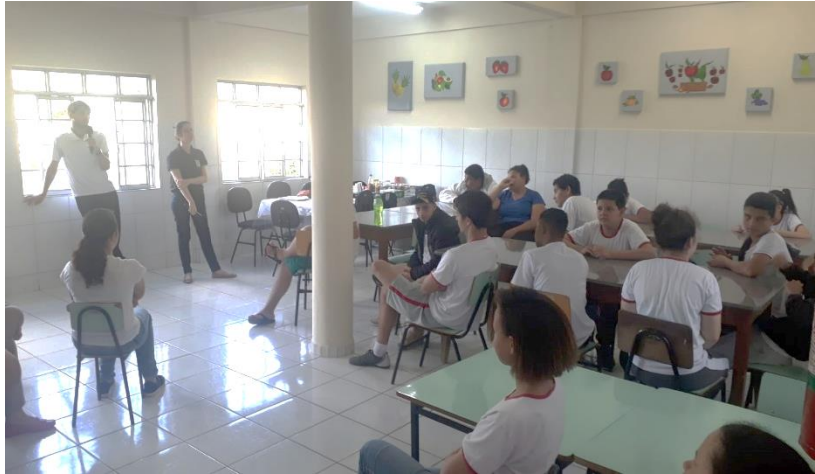
Roda de conversa de conscientização sobre o setembro amarelo

Recredenciamento de Acordo com a Resolução CEE - ES nº 5.935/2021