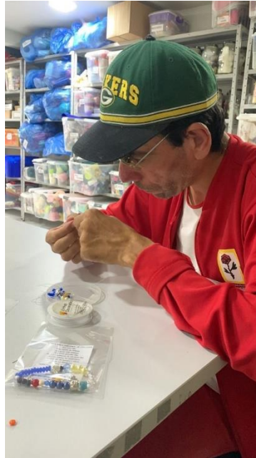
Confecção da pulseira "a mais bela história".

ASSOCIAÇÃO PESTALOZZI DE SANTA TERESA CNPJ: 32.405.664.0001-27 CAEE "MANOEL VALENTIM" CERES "GLORINHA MONTEIRO" CEVI "IDÊ VACCARI GARAYP" Utilidade Pública Federal publicada no Diário Oficial da União em 28 de março de 2002 Utilidade Pública Estadual Lei nº7999 Lei de Utilidade Pública Municipal nº1.546/2004 Recredenciamento de Acordo com a Resolução CEE - ES nº 5.935/2021