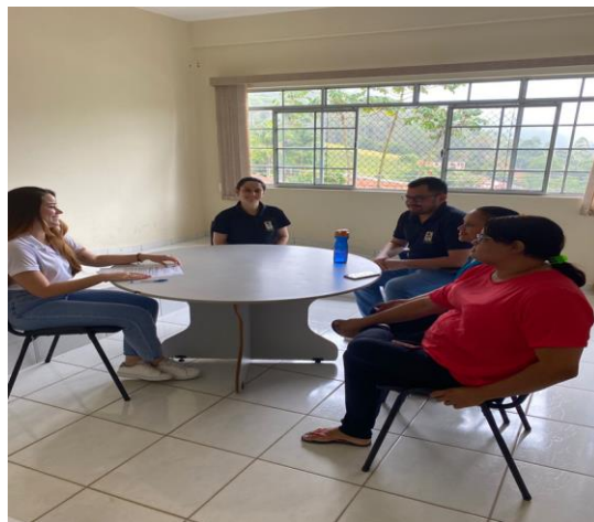
Devolutiva dos atendimentos aos responsáveis.