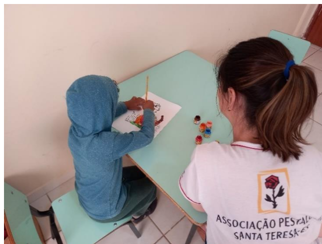
Atendimento à comunidade