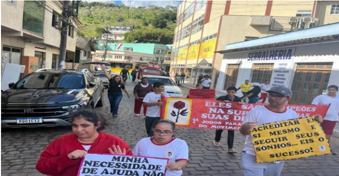
Passeata em comemoração aos jogos Paraesportivos do movimento Pestalozziano.

Rede credenciamento de acordo com a Resolução CEE - ES nº 5.935/2021