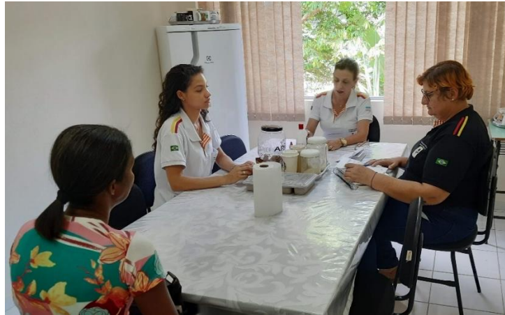
Reunião com família sobre saúde de usuária (Com diretora geral e assistente social).