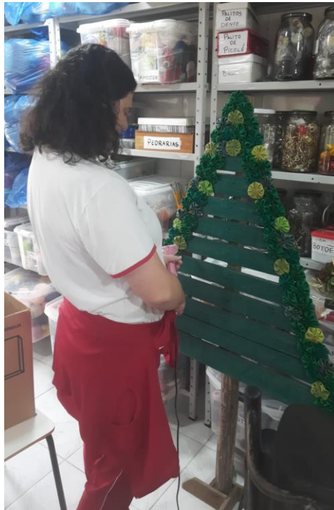
Confecção de decoração de data comemorativa (Natal).

Recredenciamento de Acordo com a Resolução CEE - ES nº 5.935/2021