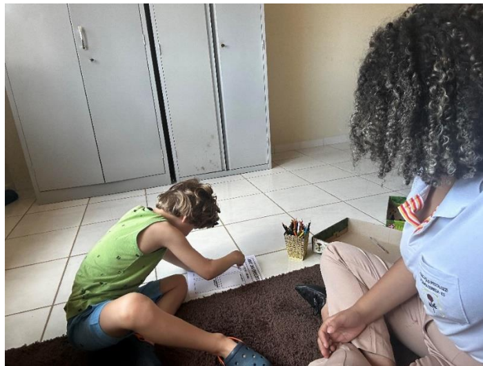
Atendimento individual em psicoterapia com alunos do AEE