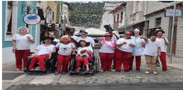
Atividade relacionada ao conteúdo Carnaval (Bloco da Pestalozzi da Rua do Lazer).