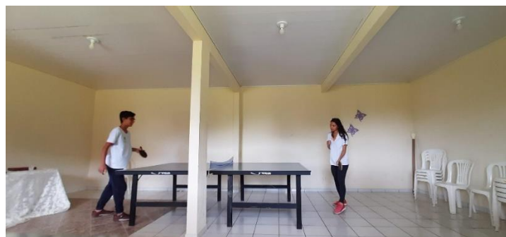
Treinamento de tênis de mesa.