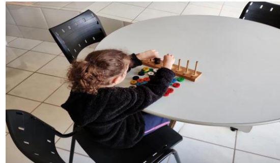
Reconhecimento/Distinação de cores