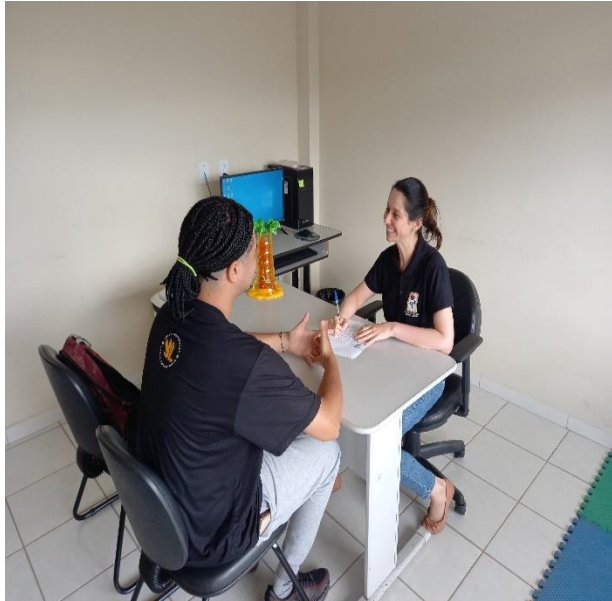
Orientação e discussão de caso com estagiários do curso de Psicologia - ESFA

Recredenciamento de Acordo com a Resolução CEE - ES nº 5.935/2021