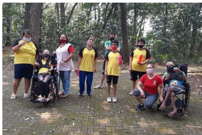
Postagem comemorativa.