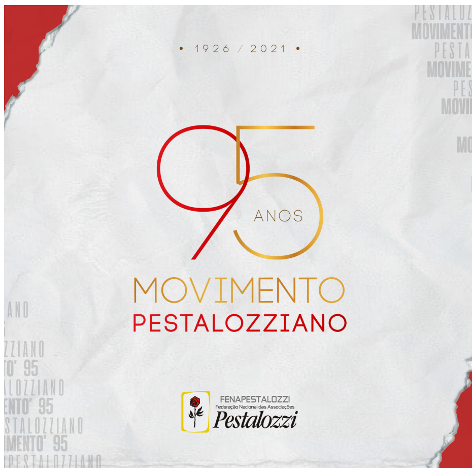
Imagem de divulgação dos 95 anos do Movimento Pestalozziano.

Helena Antipoff traz um legado de informações e aprendizagem obtido com Johann Heinrich Pestalozzi, enfatizando o trabalho na reabilitação e na formação de recursos humanos no atendimento à pessoa com deficiência. Então, são implantadas as Associações Pestalozzi em Minas Gerais, no Rio de Janeiro e em São Paulo.