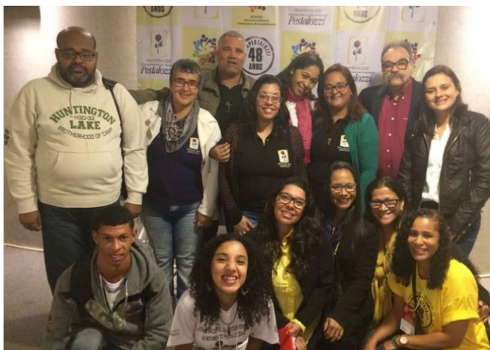
Postagem de comemoração