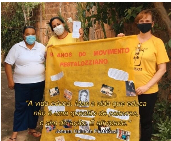
Painel comemorativo.