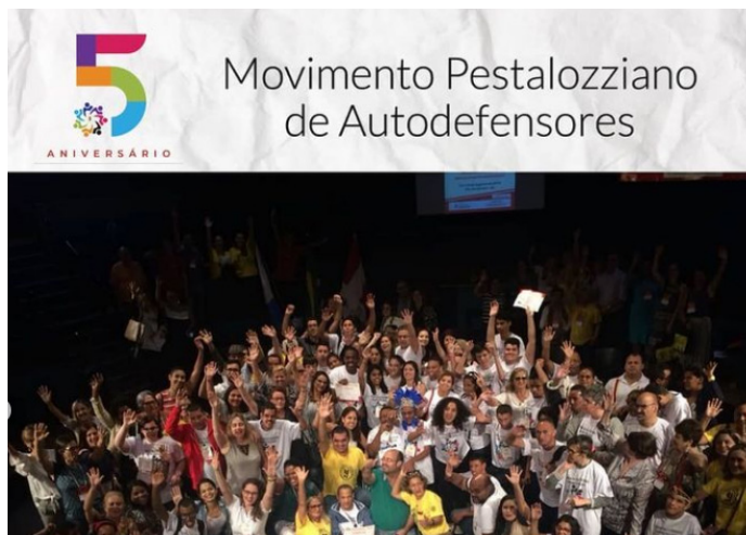
Postagem de comemoração