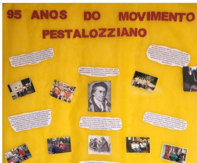
Painel comemorativo.