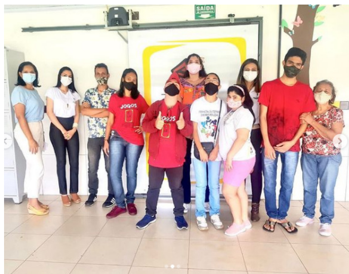
Reencontro dos atendidos.