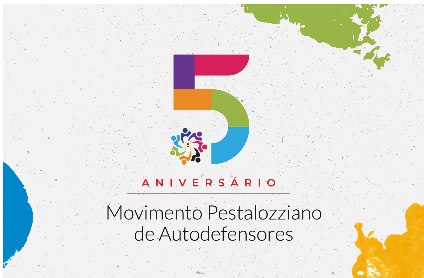
Imagem de divulgação do 5º aniversário do Monpad.

O Movimento Nacional Pestalozziano de Autodefensores - Monpad, completou 5 anos de ações e projetos que são realizados diretamente para os atendidos, através dos seus representantes autodefensores, com direito à participação em todas as decisões do conselho que compõe o Movimento e também possuem direito à voto nas escolhas que são voltadas às pessoas com deficiência.