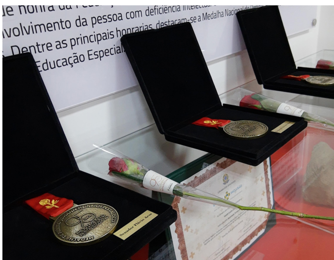
Medalhas de honraria dos 95 anos do Movimento Pestalozziano.

O Centro Histórico está situado em Brasília e já está aberto ao público.