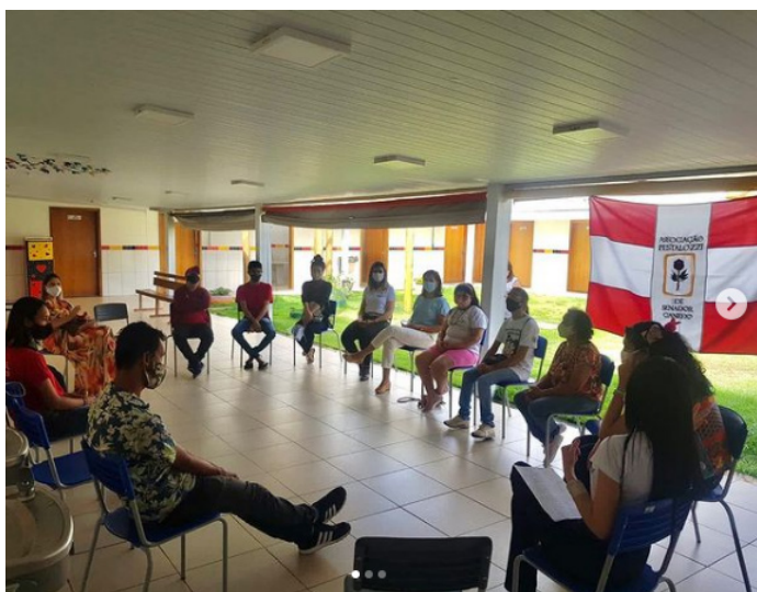
Reencontro dos atendidos.