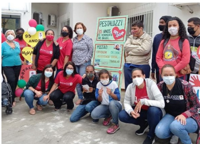
Celebração dos 95 anos.