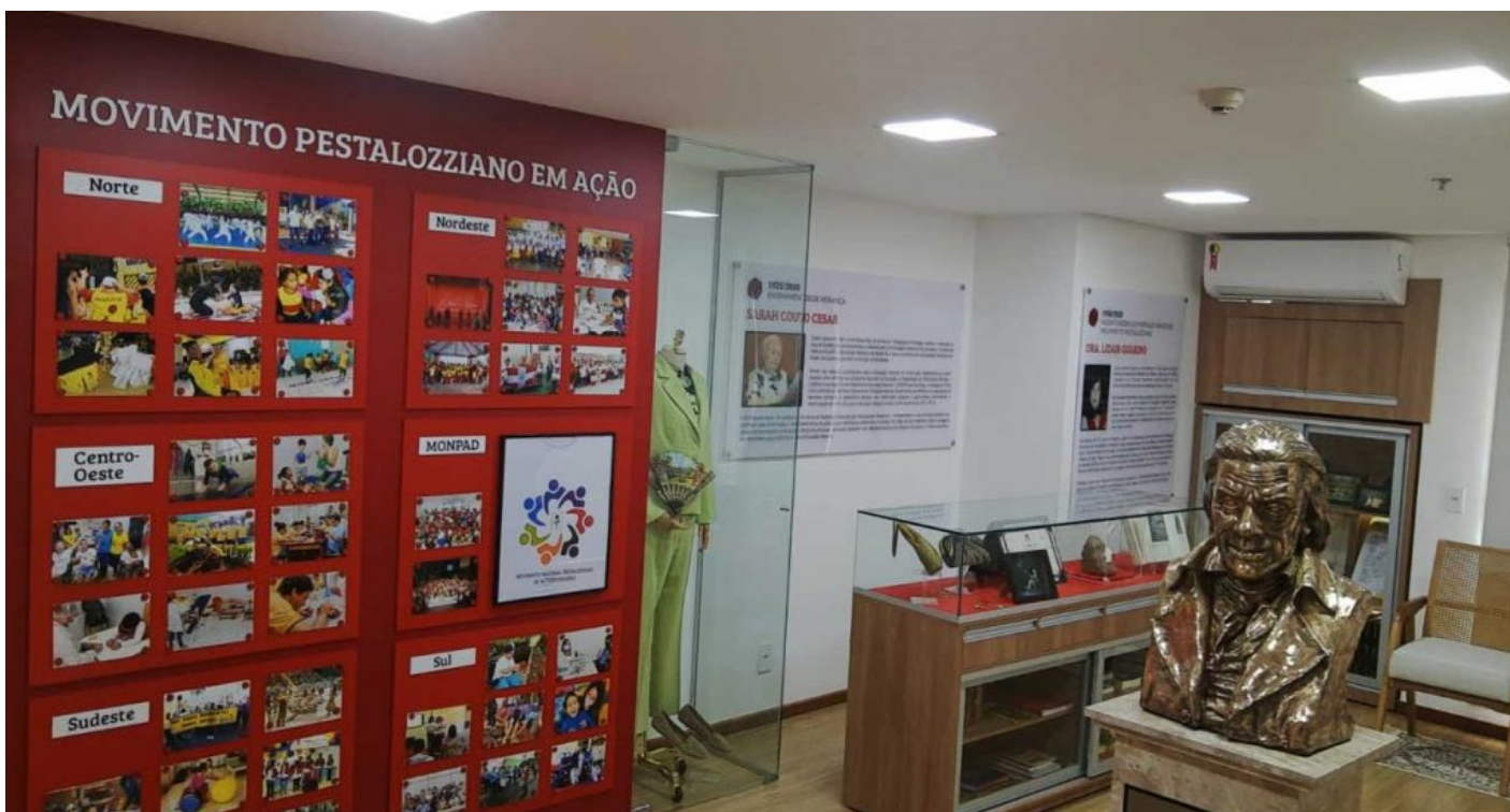
Centro Histórico do Movimento Pestalozziano Professora Sarah Couto Cesar.

Em comemoração aos 95 anos do Movimento Pestalozziano no Brasil, a Fenapestalozzi inaugura no dia 26 de outubro de 2021 o Centro Histórico do Movimento Pestalozziano Professora Sarah Couto Cesar.