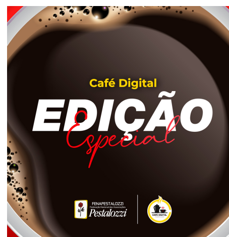
Imagem de divulgação da Edição Especial do Café Digital

encontro importante onde todos puderam saborear boas manhãs juntos.