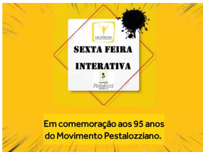
Video comemorativo.