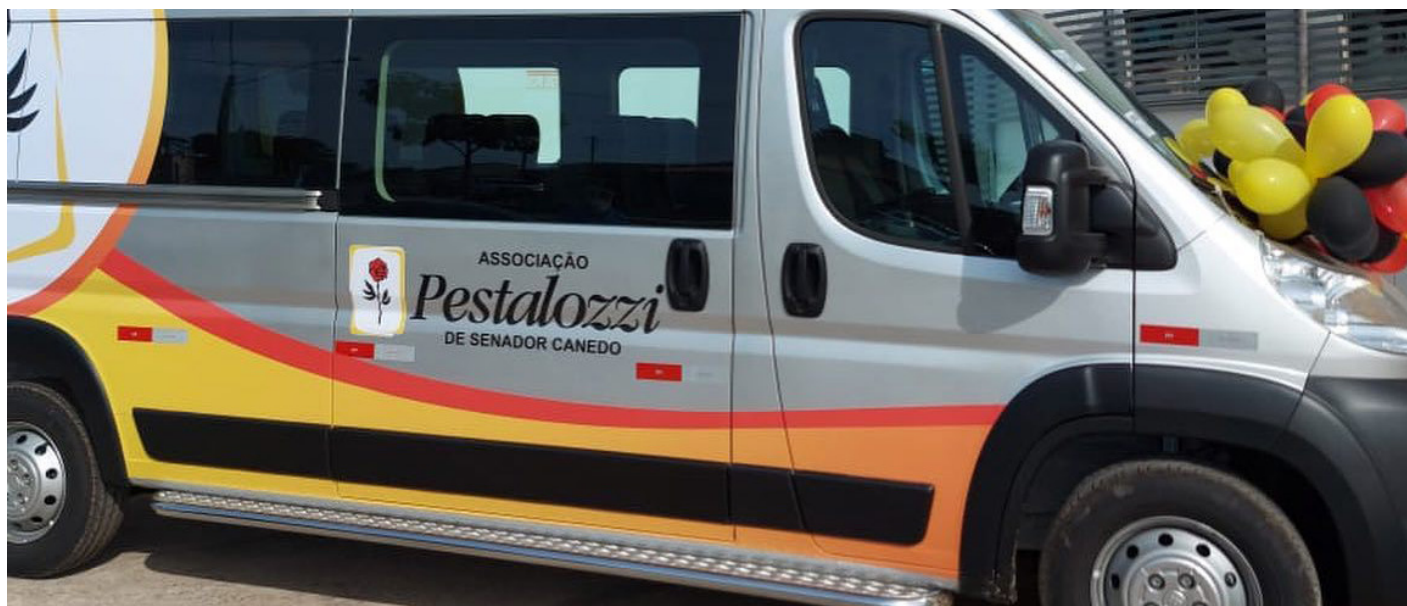
Veículos adaptados e personalizados recebido pela Associação Pestalozzi de Senador Canedo, Águia Branca e Jaguaré.

As Associações de Senador Canedo/GO, Águia Branca/ES e Jaguaré/ES receberam veículos adaptados no último trimestre de 2021. Os veículos auxiliam no transporte dos atendidos, fortalecendo o compromisso e dedicação das afiliadas com as pessoas com deficiência.