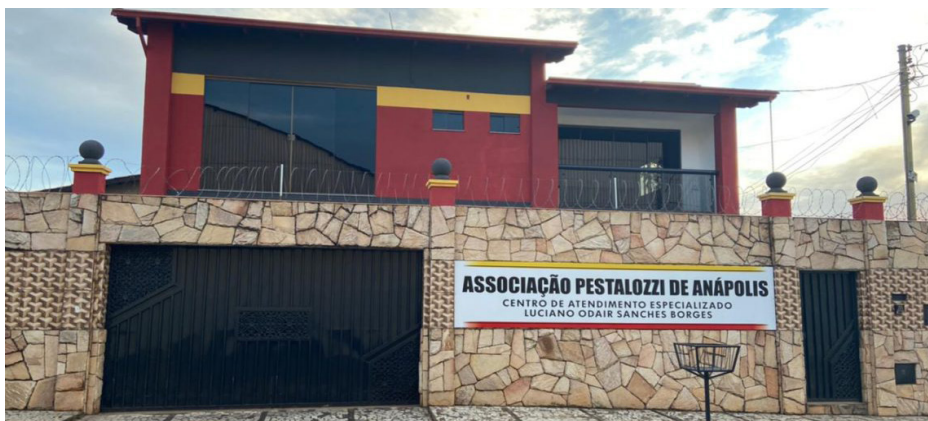
Fachada da Associação Pestalozzi de Anápolis/GO.

O Movimento Pestalozziano vem ganhando adeptos a todo momento. Dessa vez tivemos mais uma afiliada inaugurada no município de Anápolis em Goiás.