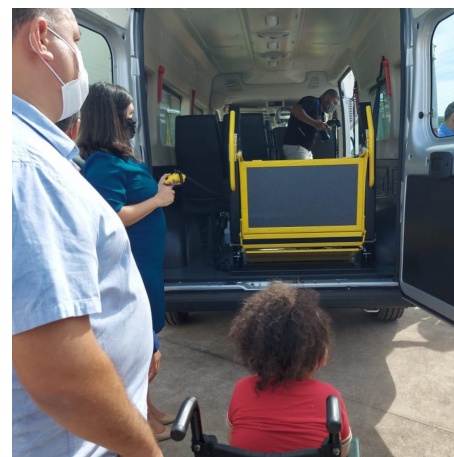
Associações recebendo os veículos adaptados.

Os veículos adaptados ajudam a conquistar ou retomar a independência, facilitando a locomoção da pessoa com deficiência e se tornando um grande aliado no dina-