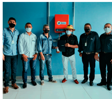
Central de energia solar.

A Pestalozzi de Ouro Preto conseguirá diminuir, consideravelmente, o valor da energia elétrica, uma vez que, todo o sistema foi instalado e está em funcionamento. Segundo a Agência Nacional de Energia Elétrica – Aneel, o valor da energia poderá chegar até R$1,50 por 100 Quilowatt de acordo com a bandeira do momento.