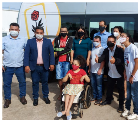
Associações recebendo os veículos adaptados.

Recentemente o Presidente Jair Bolsonaro sancionou o projeto de lei que limita a isenção do imposto sobre produtos industrializados – IPI, na compra de carros para pessoas com deficiência. Agora o valor do teto é de R$ 140 mil para compra de veículos. O limite para a troca também está diferente, podendo ser feita a cada três anos, ou então o beneficiário deverá pagar todo o imposto que não foi recolhido.