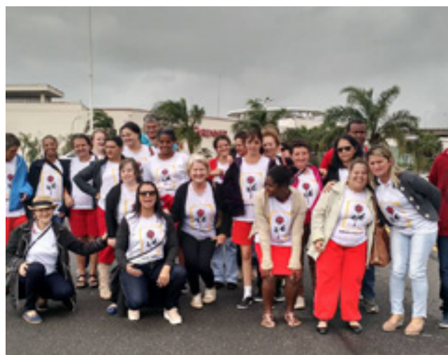
Programação especial na Semana da Pessoa com Deficiência na Pestalozzi de Itarana