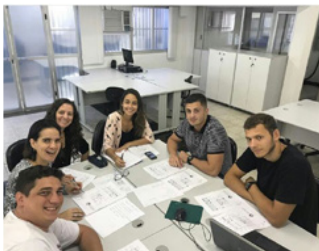
Estudantes universitários realizam reforma na Pestalozzi de Vila Velha, no Espírito Santo