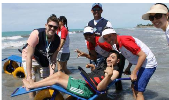
Pestalozzi de Maceió comemora Semana Nacional da Pessoa com Deficiência

Fenapestalozzi completa ciclo de visitas às afiliadas da Rede Pestalozzi com viagem para Água Boa | Pág. 4