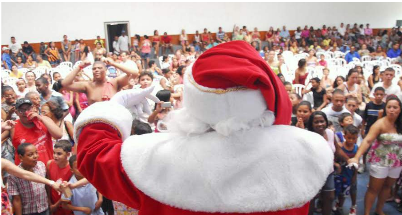
Evento marca o encerramento das atividades educacionais do ano.

Niterói (RJ) - Centenas de crianças, adolescentes e seus familiares participarão na manhã desta quinta-feira, dia 15, da festa de chegada de Papai Noel na Associação Pestalozzi de Niterói. O evento tem início às 10h com apresentações artísticas e em seguida Papai Noel sobe ao palco, preparado para o evento, para desejar um feliz natal e iniciar a entrega dos presentes doados por voluntários a todas as crianças que são assistidas pela