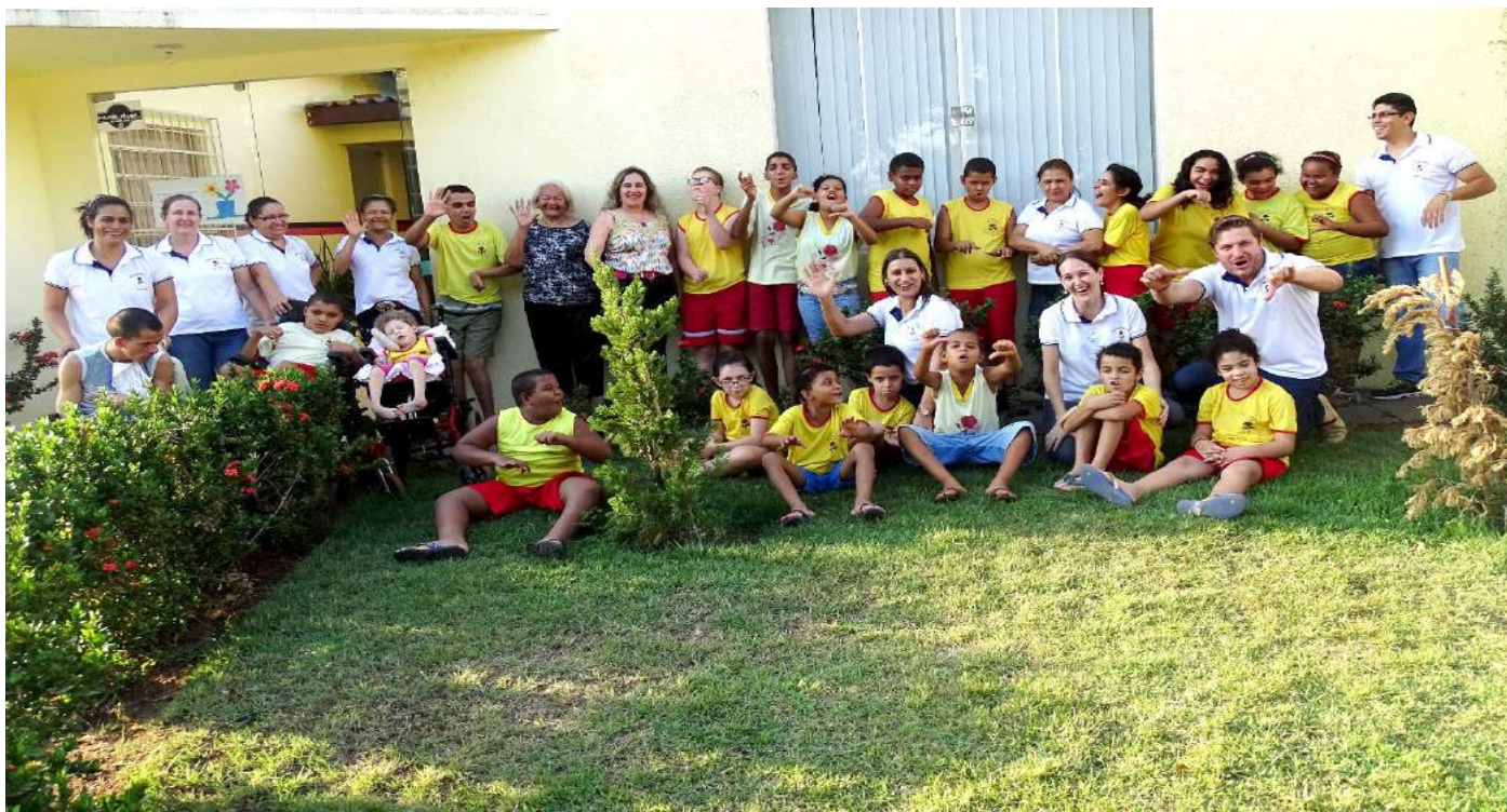
Ester Pacheco com colaboradores e atendidos durante visita à Associação Pestalozzi de Água Boa.

Água Boa (MT) - A união entre associações, entidades análogas e poder público que trabalham em defesa da pessoa com deficiência foi debate durante a visita da presidente da Federação Nacional das Associações Pestalozzi, Ester Pacheco, à Pestalozzi de Água Boa. “Os avanços das políticas públicas para a pessoa com deficiência está ganhando força porque estamos unidos e juntos garantindo cada dia mais espaço para a matéria”, enfatizou Ester Pacheco.