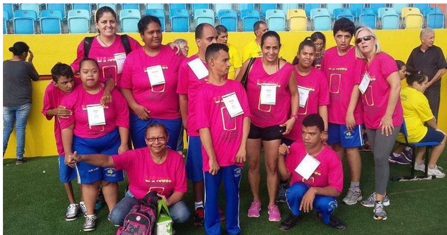
Atendidos participam de VI Jogos Paradesportivos das Associações Pestalozzi.

As fotos do VI Jogos Paradesportivos das Associações Pestalozzi podem ser vistas na página da Fenapestalozzi no Facebook.