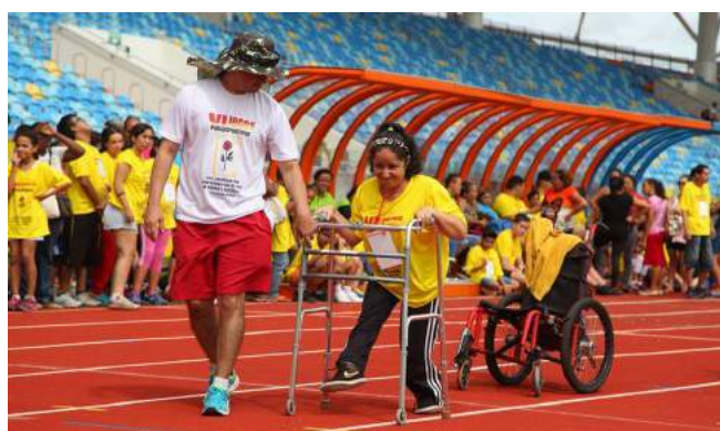
Faspego realiza o VI Jogos Paradesportivos das Associações Pestalozzi do Estado de Goiás