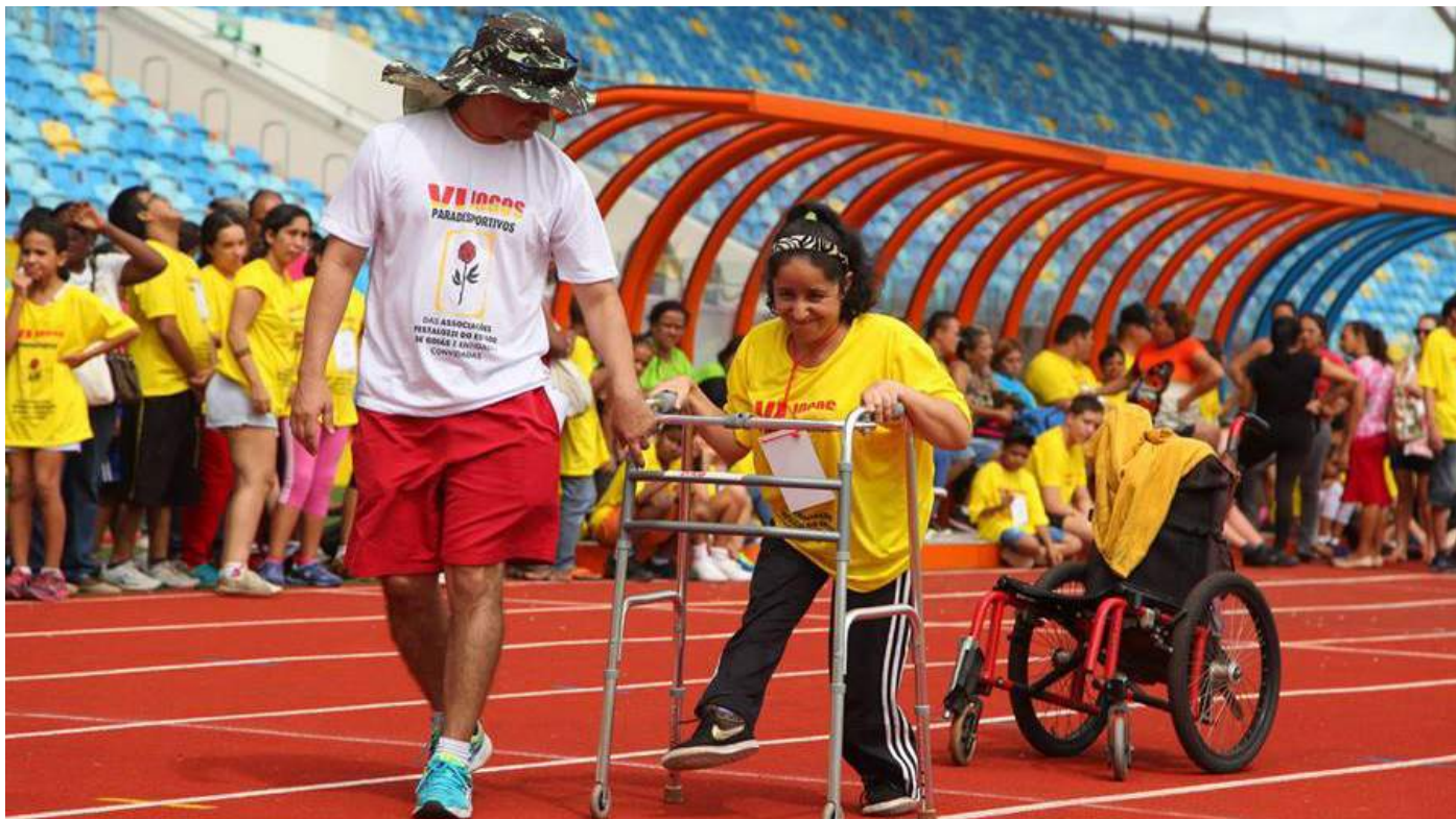
O evento reuniu 14 instituições e 750 atletas de Goiás e do Distrito Federal.

Goiânia (GO) - A Federação das Associações Pestalozzi do Estado de Goiás (Faspego) realizou o VI Jogos Paradesportivos das Associações Pestalozzi e Entidades Convidadas do dia 28 a 30 de novembro em Goiânia. O evento, apoiado pela Federação Nacional das Associações Pestalozzi (Fenapestalozzi), aconteceu no SESI Clube Antônio Ferreira Pacheco e no Estádio Olímpico Pedro Ludovico Teixeira, reunindo 14 instituições e 750 atletas com deficiência intelectual ou múltipla, síndromes e transtornos.