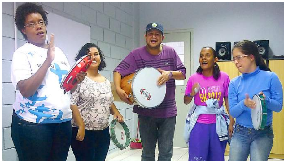
Atendidos participam de oficina pedagógica de Musicoterapia.

Por isso é que a Pestalozzi de Osasco é muito especial. Ela oferece os apoios necessários para que o adolescente possa enfrentar esse “abismo” e prossiga seu caminho em direção a uma vida adulta, com independência, autonomia e, principalmente,