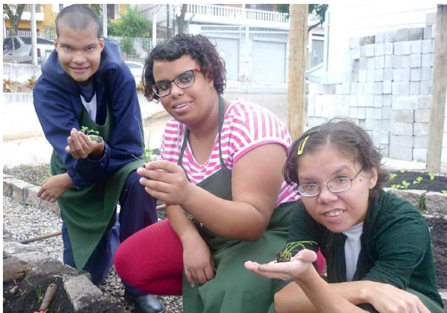
Oficinas pedagógicas de Horticultura também são realizadas na instituição.

Em 2015, uma média de 150 pessoas com deficiência intelectual e suas famílias, foram beneficiadas com os serviços que foram oferecidos gratuitamente. Além disso, oito aprendizes que ingressaram no mercado