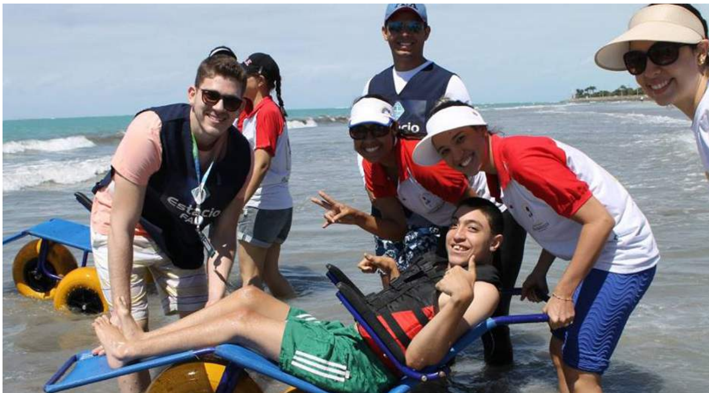
Dia de Lazer na Praia: o evento faz parte do calendário anual da Associação Pestalozzi de Maceió.

S ol. Areia. Mar. Praia. Sombra e água fresca. Esse foi o cenário escolhido pela Associação Pestalozzi de Maceió (AL) para realizar um dia de lazer diferente com os atendidos. O evento aconteceu no dia 25 de agosto, das 8h às 11h, na praia de Pajuçara, em Maceió. A ação faz parte do calendário de atividades da Semana Nacional da Pessoa com Deficiência e marca um momento singular de inclusão, diversão e interação.