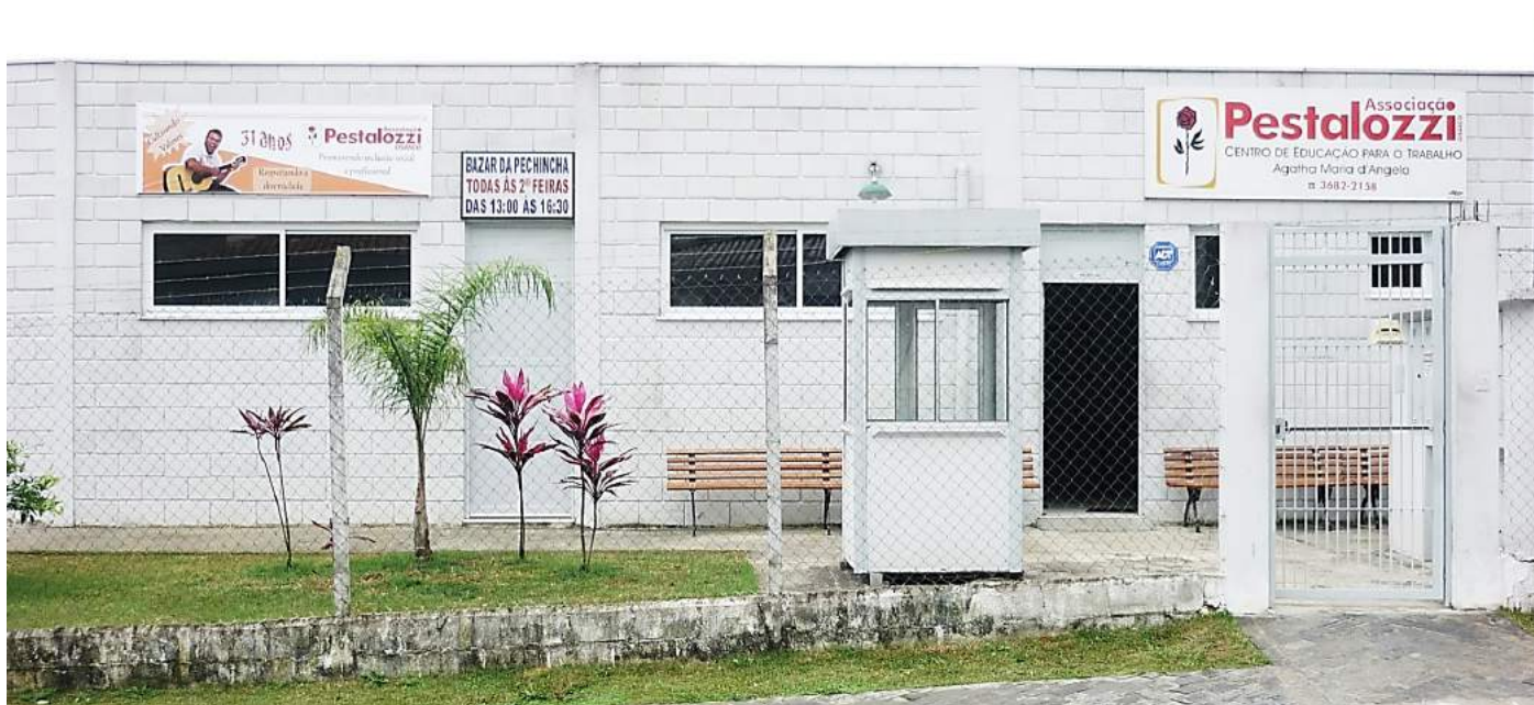
A instituição comemora 34 anos de atuação no município paulista.

Osasco (SP) - Talvez você leitor não saiba, mas, há 34 anos, existe uma Pestalozzi em Osasco que já ajudou a transformar a vida de muitas pessoas com deficiência intelectual e, conseqüentemente, de suas famílias.