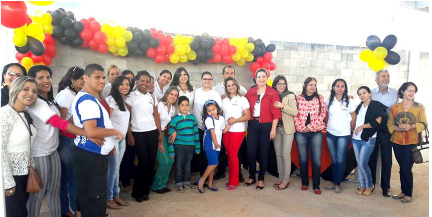
Dirigentes, profissionais e atendidos comemoraram o seis anos da Associação Pestalozzi de Senador Canedo.

A Associação Pestalozzi de Senador Canedo (GO) comemorou no dia 30 de junho seis anos de existência. E para celebrar o aniversário realizou um café da manhã no local onde está sendo construída a nova sede da associação, no Bairro São Francisco II.