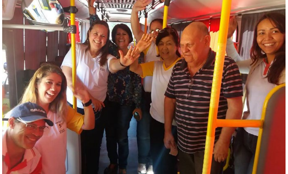
Doação do ônibus escolar foi viabilizada em parceria com o Ministério Público do Trabalho.

e festividades. Sérgio Belmonte, revelou que antes as atividades externas eram realizadas com a locação de veículos e com a colaboração dos pais.