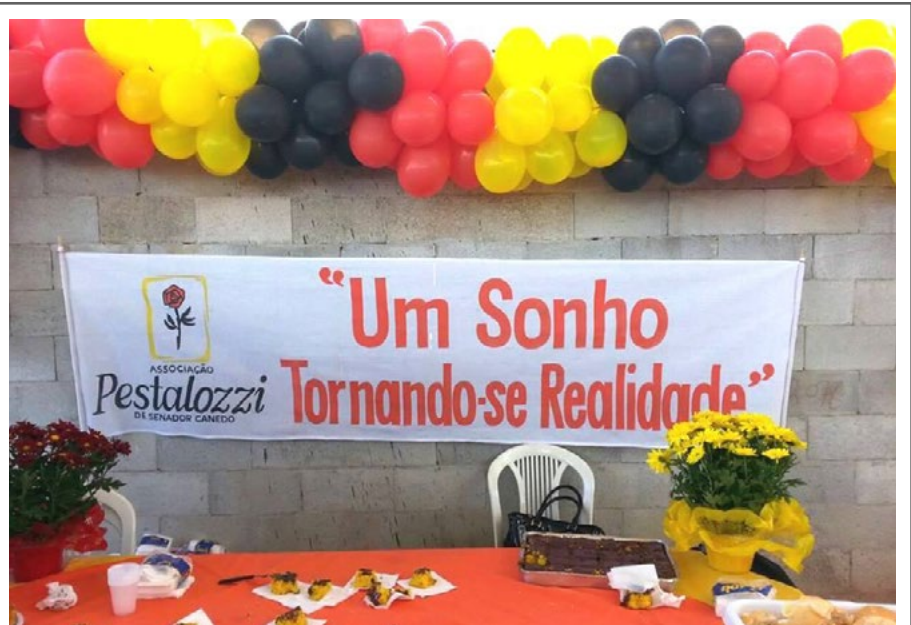
Eventos beneficentes ajudam captar recursos para realização do sonho da sede própria da Associação Pestalozzi de Senador Canedo.