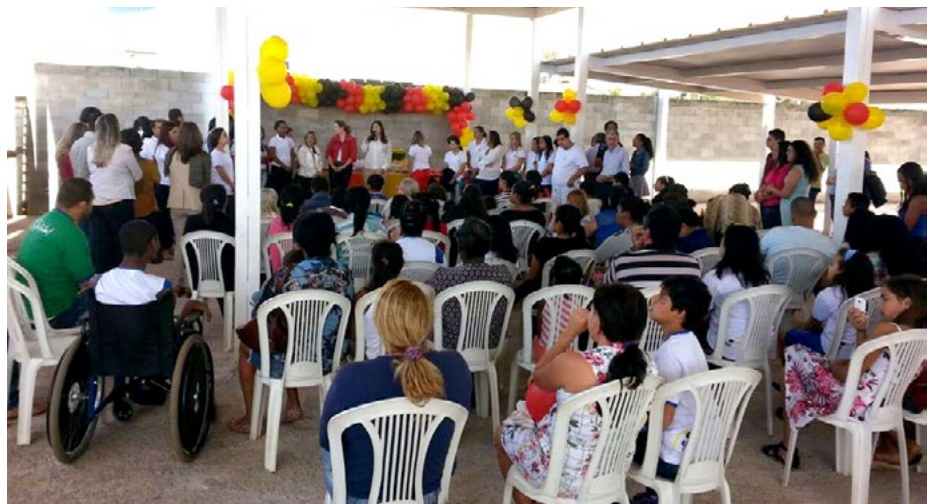
O evento aconteceu no local onde será a sede própria da instituição.

Ao longo destes seis anos, a associação contou com o apoio da prefeitura, parceiros, colaboradores, voluntários e amigos da Pestalozzi. “Tivemos muitas dificuldades, mas alcançamos grandes e merecidas vitórias”, celebrou a presidente. Ela afirmou que a associação precisa ampliar a capacidade de